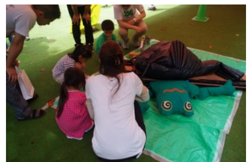
防災プログラムを楽しむ様子（ジャッキアップゲーム）