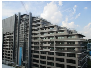
A街区工事状況 (8月25日撮影)